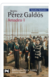
AMADEO I BENITO PÉREZ GALDÓS