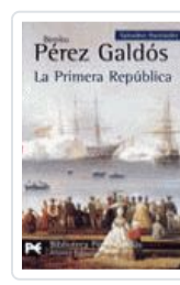
PRIMERA REPUBLICA BENITO PÉREZ GALDÓS