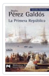
PRIMERA REPUBLICA BENITO PÉREZ GALDOS