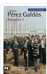
AMADEO I BENITO PÉREZ GALDOS