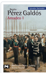
AMADEO I BENITO PEREZ GALDOS