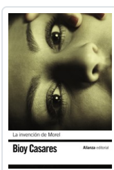
INVENCION DE MOREL ADOLFO BIOY CASARES