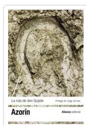
RUTA DE DON QUIJOTE AZORIN JOSE MARTINEZ RUIZ