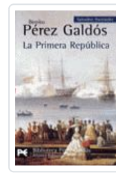
PRIMERA REPUBLICA BENITO PEREZ GALDOS