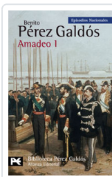
AMADEO I BENITO PEREZ GALDOS