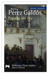
ESPAÑA SIN REY BENITO PEREZ GALDOS