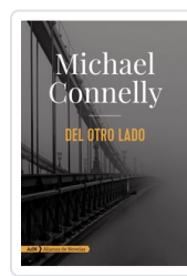
DEL OTRO LADO (ADN) MICHAEL CONNELLY