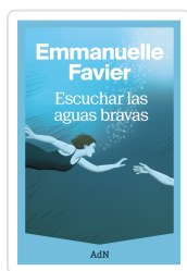
ESCUCHAR LAS AGUAS BRAVAS FAVIER, EMMANUELLE