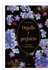
ORGULLO Y PREJUICIO (EL JARDIN SECRETO) AUSTEN, JANE