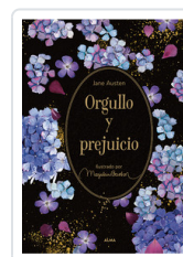
ORGULLO Y PREJUICIO (EL JARDIN SECRETO) AUSTEN, JANE