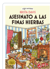
ASESINATO A LAS FINAS HIERBAS (COZY MYSTERY) DAVIS, KRISTA