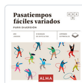
PASATIEMPOS FACILES VARIADOS. PURA DIVERSION SESE, MIQUEL