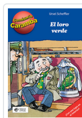
COMISARIO CARAMBA, 4 LORO VERDE SCHEFFLER, URSEL