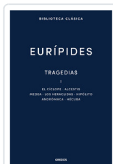
TRAGEDIAS I. EL CICLOPE. ALCESTIS. MEDEA. LOS HERACLIDAS. H EURIPIDES