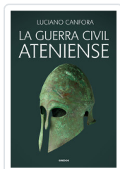
GUERRA CIVIL ATENIENSE, LA CANFORA, LUCIANO