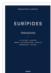
TRAGEDIAS I. EL CICLOPE. ALCESTIS. MEDEA. LOS HERACLIDAS. H EURIPIDES