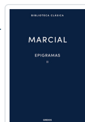
EPIGRAMAS II MARCIAL