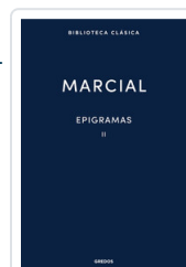
EPIGRAMAS II MARCIAL