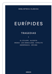
TRAGEDIAS I. EL CICLOPE. ALCESTIS. MEDEA. LOS HERACLIDAS. H EURIPIDES