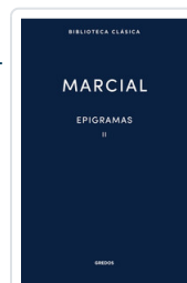
EPIGRAMAS II MARCIAL