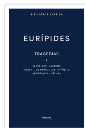
TRAGEDIAS I. EL CICLOPE. ALCESTIS. MEDEA. LOS HERACLIDAS. EURIPIDES