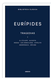
TRAGEDIAS I. EL CICLOPE. ALCESTIS. MEDEA. LOS HERACLIDAS. H EURIPIDES