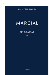
EPIGRAMAS II MARCIAL