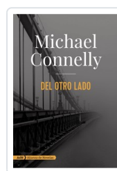
DEL OTRO LADO (ADN) MICHAEL CONNELLY