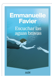
ESCUCHAR LAS AGUAS BRAVAS FAVIER, EMMANUELLE