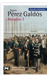
AMADEO I BENITO PEREZ GALDOS