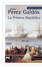
PRIMERA REPUBLICA BENITO PEREZ GALDOS