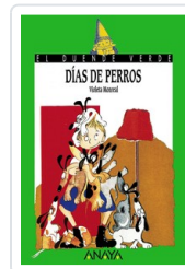
DÍAS DE PERROS VIOLETA MONREAL