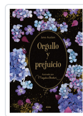
ORGULLO Y PREJUICIO (EL JARDIN SECRETO) AUSTEN, JANE