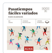
PASATIEMPOS FÁCILES VARIADOS. PURA DIVERSION SESE, MIQUEL