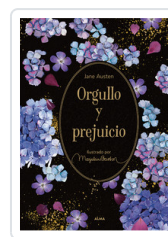
ORGULLO Y PREJUICIO (EL JARDIN SECRETO) AUSTEN, JANE