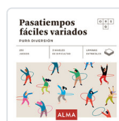
PASATIEMPOS FACILES VARIADOS. PURA DIVERSION SESE, MIQUEL