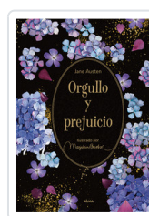
ORGULLO Y PREJUICIO (EL JARDIN SECRETO) AUSTEN, JANE