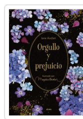
ORGULLO Y PREJUICIO (EL JARDIN SECRETO) AUSTEN, JANE