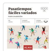
PASATIEMPOS FACILES VARIADOS. PURA DIVERSION SESE, MIQUEL