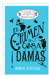
CRIMEN ES COSA DE DAMAS (COZY MYSTERY JUVENIL) STEVENS, ROBIN