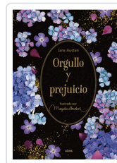
ORGULLO Y PREJUICIO (EL JARDIN SECRETO) AUSTEN, JANE