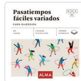
PASATIEMPOS FACILES VARIADOS. PURA DIVERSION SESE, MIQUEL