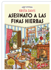
ASESINATO A LAS FINAS HIERBAS (COZY MYSTERY) DAVIS, KRISTA