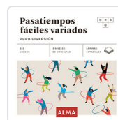
PASATIEMPOS FÁCILES VARIADOS. PURA DIVERSION SESE, MIQUEL