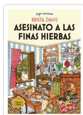
ASESINATO A LAS FINAS HIERBAS (COZY MYSTERY) DAVIS, KRISTA