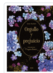
ORGULLO Y PREJUICIO (EL JARDIN SECRETO) AUSTEN, JANE