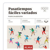
PASATIEMPOS FÁCILES VARIADOS. PURA DIVERSION SESE, MIQUEL