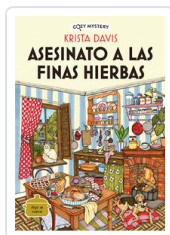
ASESINATO A LAS FINAS HIERBAS (COZY MYSTERY) DAVIS, KRISTA