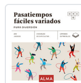
PASATIEMPOS FÁCILES VARIADOS. PURA DIVERSION SESE, MIQUEL