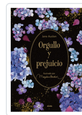
ORGULLO Y PREJUICIO (EL JARDIN SECRETO) AUSTEN, JANE