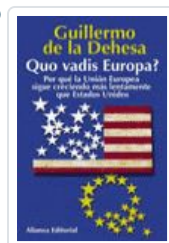
QUO VADIS EUROPA? GUILLERMO DE LA DEHESA