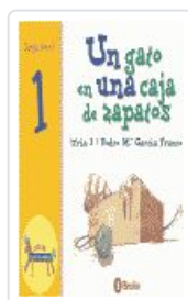
UN GATO EN UNA CAJA DE ZAPATOS GARCIA, PEDRO MARIA