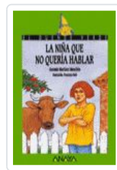
NIÑA QUE NO QUERIA HABLAR ANTONIO MARTINEZ MENCHEN