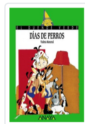
DÍAS DE PERROS VIOLETA MONREAL