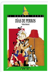
DÍAS DE PERROS VIOLETA MONREAL