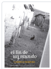
FIN DE UN MUNDO, EL ROMERO SALVADOR, CARMELO