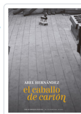
CABALLO DE CARTON, EL HERNANDEZ DOMINGUEZ, ABEL