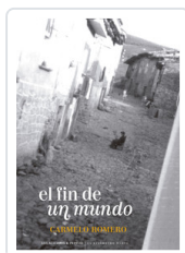
FIN DE UN MUNDO, EL ROMERO SALVADOR, CARMELO