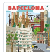
BARCELONA SERRA, SEBASTIA