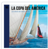
AMERICA'S CUP LEGENDARY SAILING YACHTS SERRAT, SANTI