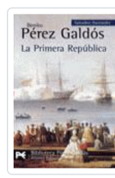
PRIMERA REPUBLICA BENITO PÉREZ GALDOS