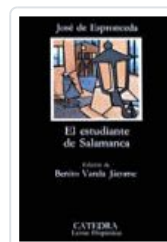
ESTUDIANTE DE SALAMANCA JOSE DE ESPRONCEDA