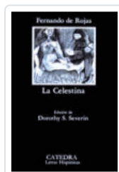
CELESTINA FERNANDO DE ROJAS