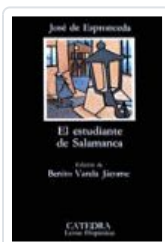
ESTUDIANTE DE SALAMANCA JOSE DE ESPRONCEDA