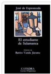
ESTUDIANTE DE SALAMANCA JOSE DE ESPRONCEDA