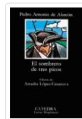
SOMBRERO DE TRES PICOS PEDRO ANTONIO DE ALARCON ARI