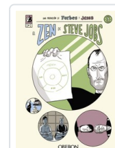
ZEN DE STEVE JOBS FORBES