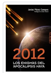
2012. LOS ENIGMAS DEL APOCALIPSIS MAYA JAVIER PEREZ CAMPOS