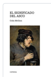
SIGNIFICADO DEL ASCO COLIN MCGINN