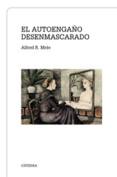
AUTOENGAÑO DESENMASCARADO ALFRED R. MELE