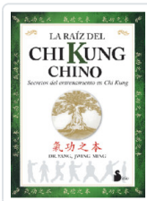
LA RAÍZ DEL CHI KUNG CHINO YANG, JWING-MING