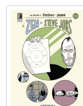
ZEN DE STEVE JOBS FORBES