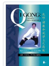
QIGONG SALUD Y ARTES MARCIALES YANG, JWING-MING