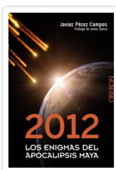
2012. LOS ENIGMAS DEL APOCALIPSIS MAYA JAVIER PEREZ CAMPOS