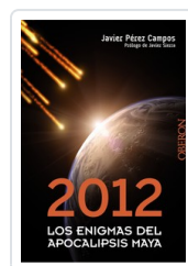
2012. LOS ENIGMAS DEL APOCALIPSIS MAYA JAVIER PEREZ CAMPOS