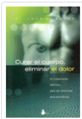
CURAR EL CUERPO ELIMINAR DOLOR SARNO, JOHN