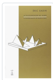
SILICONIZACION DEL MUNDO, LA SADIN, ERIC