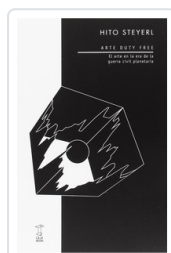
ARTE DUTY FREE STEYERL, HITO