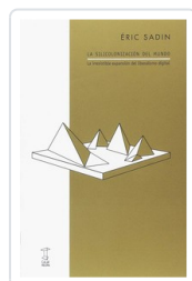
SILICONIZACION DEL MUNDO, LA SADIN, ERIC