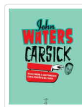
CARSICK DE BALTIMORE Y A SAN FRANCISCO WALTERS, JOHN