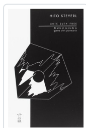
ARTE DUTY FREE STEYERL, HITO