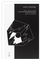
ARTE DUTY FREE STEYERL, HITO