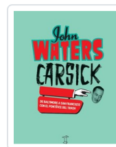
CARSICK DE BALTIMORE Y A SAN FRANCISCO WALTERS, JOHN