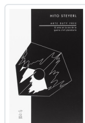
ARTE DUTY FREE STEYERL, HITO