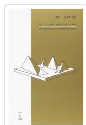
SILICONIZACION DEL MUNDO, LA SADIN, ERIC