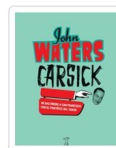
CARSICK DE BALTIMORE Y A SAN FRANCISCO WALTERS, JOHN